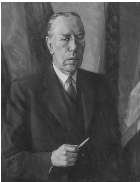
Porträtt utfört av konstnären Carl Gunne på uppdrag av Stiftelsen Uppsalahem

Tycho Hedén var socialist i detta ords djupa och verkliga mening. Storheten i hans gärning motsvarades av enkelheten i framträdandet. Han sökte inte offentlighetens ljus. Han trivdes bäst i det hårda politiska vardagslivet. Hans yttre attityd gav också liksom pregnans