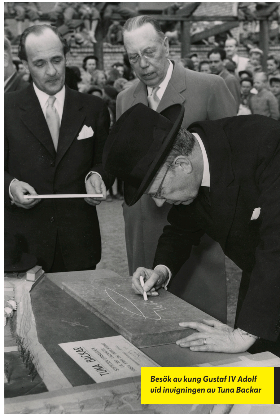
Besök av kung Gustaf IV Adolf vid invigningen av Tuna Backar

Med Tycho Hedéns bortgång förlorar företaget sin mest framträdande personliga gestalt och företaget förblir i stor tacksamhetsskuld för hans betydande och grundläggande insatser.